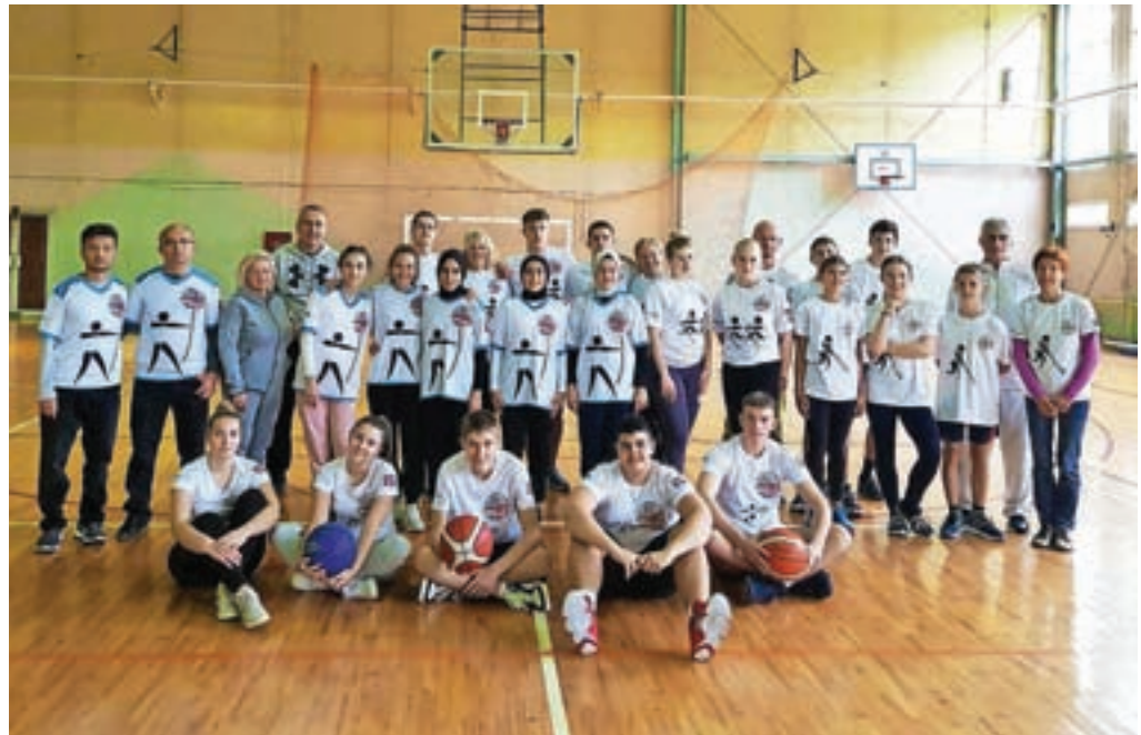
Osrednja športna dejavnost na gostovanju v Srbiji je bila kajpada košarka.

Leta 2018 so rudnike s pripadajočo opremo kupili Kitajci in od takrat naprej se dnevni kopi večajo, količina pridobljenega in prodanega bakra pa iz dneva v dan narašča. Danes je v rudniku zaposlenih več kot sedem tisoč kitajskih delavcev in okrog pet tisoč domačinov, ki so za srbske razmere kar dobro plačani – njihov mesečni prihodek je od dva- do trikrat tolikšen kot plača učitelja. Vendar pa je to zgolj ena plat zgodbe, druga je mnogo bolj temačna in zastrašujoča. Kitajci zaradi širitve rudnikov preseljujejo domače prebivalstvo, zrak v Boru in njegovi okolici je ves čas poln drobnih delcev prahu, ljudje množično zbolevajo zaradi bolezni dihal in umirajo prezgodaj. Ko sem se pogovarjala s tamkajšnjimi ljudmi, sem v njihovih besedah in izrazih