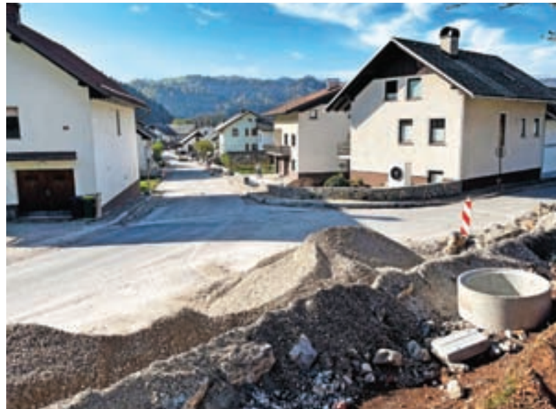
V Novi vasi poteka rekonstrukcija ceste in gradnja pločnikov na 550 metrov dolgem odseku.

Končali pa so že obnovo Dražgoške ulice, ki je bila v zelo slabem stanju, je pojasnil Kranjc. »Na novo smo uredili spodnji ustroj ceste in ga prevlekli z asfaltom. Sočasno so tamkajšnji prebivalci na lastne stroške poskrbeli za vgradnjo cevi za električne vode.« Občina je za naložbo odštela 60 tisoč evrov. Ta čas končujejo tudi asfaltiranje štirih odsekov cest v okolici Žirov, naložba je vredna 130 tisoč evrov. »Domačini iz Koprivnika, Jarčje Doline in Žirovskega Vrha so pripravili spodnji ustroj ceste na dosedanjih makadamskih cestah, občina pa je financirala asfaltiranje,« je pojasnil Kranjc. Pred kratkim so začeli obnavljati še Ulico Maksima Sedeja, in sicer gre za obnovo dotrajanega vozišča, ob katerem bodo zgradili še novo javno razsvetljavo. Obstoječo cesto bodo razširili in tako kot v Novi vasi položili cevi za optično omrežje, obenem bodo zamenjali vodovodno in kanalizacijsko omrežje. »Dela bodo vredna 350 tisoč evrov, njihov zaključek pa je predviden prihodnje leto.« Kranjc je poudaril še gradnjo opornega zidu ob cesti v Novi vasi, kjer je struga Račeve spodjedla cesto; dela bodo vredna okrog 50 tisoč evrov. V Žirovnici pa so sanirali brežino ob cesti, ki je bila poškodovana v septembrskih poplavih, za kar so odšteli 15 tisoč evrov. »Sicer pa glede na