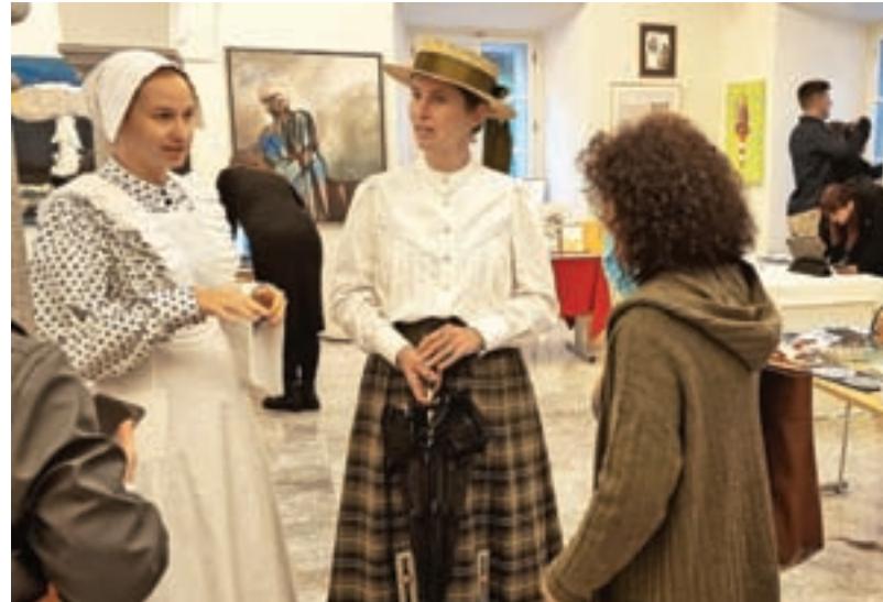
V Kulturnem središču Stare Žiri so predstavili projekte, ki so jih sofinancirali s pomočjo sredstev v okviru projekta CCI4Tourism.

Škofjeloška trgovina Rozamunda je v sodelovanju s Turističnim društvom Škofja Loka v sklopu projekta razvila spominko Loške hiše. Motive loških hiš je mogoče najti na razglednicah, priponkah, čokoladah, vrečkah in majicah. KUD Kamot je v sodelovanju s Turističnim društvom Gorje v sklopu projekta nadgradil njihovo tematsko pot Začaran gozd s slikanico Volčje potovanje od Vintgarja do Soteske. Gostilna Pr' Pepet in E-Art Institut sta predstavila glasbeno-gastronomski abonma Loške glasbene vilice. V okviru omenjenega abonmaja so si zamislili večerjo s štirimi hodi, ki jo pospremi s koncertom v kletnih prostorih gostilne v predahu med posame-