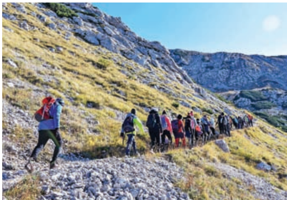
Sedmošolci so se udeležili planinske šole v naravi.

Priznanje za uspešno izpeljan program zaslužijo vsi sodelujoči učitelji in gorski reševalec Rakušček, ki so skupaj zagotovili potrebno varnost v tem projektu. Zahvala gre tudi Planinskemu društvu Žiri ter Občini Žiri za finančno pomoč.