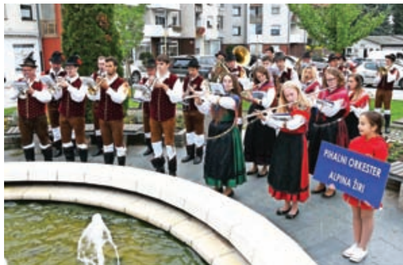
Promenadni nastop Pihalnega orkestra Alpina Žiri na tržnici v Hrastniku

A leto 75. obletnice ustanovitve si bomo zapomnili tudi po tem, da smo se konec aprila poslovili od častnega člana našega orkestra, dolgoletnega predsednika Vikija Žaklja. Tudi pol leta po tem, ko ga ni več med nami, lahko potrdimo, da nas njegova raznovrstna zapuščina pogosto spomni nanj. Zadnje tedne, ko preurejamo zalogo narodnih noš, se čudimo njegovi vestnosti pri skrbi za vsa oblačila, ki so še vedno dobro ohranjena, da jih lahko uporabljamo še danes, pa so nekatera stara več kot 20 let. In kadarkoli pripravljamo koncertni program in prečesavamo arhiv, se z občudovanjem prebijamo skozi obsežno zbirko not, ki jo je Viki skrbno hranil (not je več kot 700!). Da niti ne govorimo o tem, kako nas na gostovanjih godbeniki še vedno sprašujejo po vsepovsod znanem Vikiju. Naša skupna pot se je morda res končala, a vsaj za budnico bo zagotovo vedno zavila tudi mimo Vikijeve Nade.