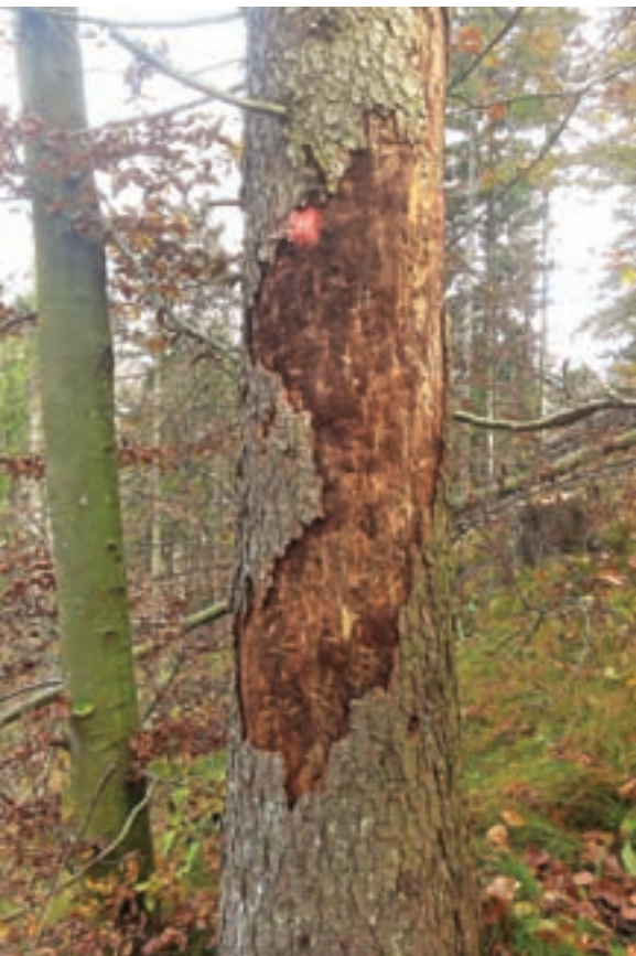
Za lubadarke je značilno tudi odstopanje in odpadanje skorje z debla.

nikov lahko pričakujemo tudi v prihodnjem letu. Jeseni in pozimi bo Zavod za gozdove Slovenije nadaljeval pregled gozdov in lastnikom gozdov z odločbo določal posek s podlubniki napadenih dreves – lubadark. Lubadarke v poznem poletju in jeseni prepoznamo po rjavi črvini okoli koreničnika in za luskami skorje, odpadanju iglic z obarvane ali še zelene krošnje ter odstopanju in odpadanju skorje z debla. Čez zimo smo po-