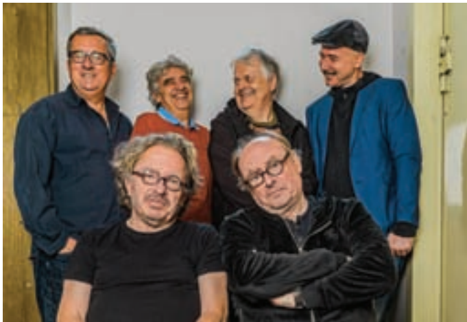
Ustvarjalci predstave Moj živòt je ROKentROL