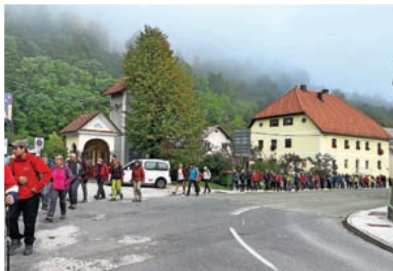
Letošnjega pohoda ob rapalski meji se je udeležilo okrog 140 pohodnikov.