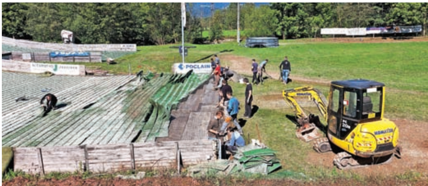
Sanacija škode po poplavih

Glede na to, da smo v zaključku oktobra, prav tako z veseljem sporočamo, da smo letos beležili visok vpis najmlajših članov. Vsekakor pa bomo veseli, če se nam bo v prihodnje pridružil še kak član.