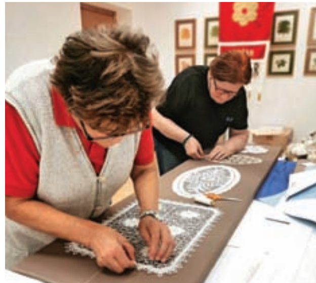
Ta veseli dan kulture bodo v Žireh zaznamovali z odprtjem razstave Klekljane čipke, »špice« na Žirovskem.

Razstava Klekljane čipke, »špice« na Žirovskem je nastala na pobudo Občine Žiri. Strokovno jo je pripravil Loški muzej Škofja Loka v sodelovanju s Klekljarskim društvom Cvetke Žiri, Muzejskim društvom Žiri in Čipkarsko šolo Žiri. Vse ljubitelje klekljanja vabimo na odprtje razstave, ki bo v soboto, 3. decembra 2022, ob 17. uri v Stari šoli v Žireh. Veselimo se vašega obiska. Projekt sofinancirata Evropska unija iz Evropskega kmetijskega sklada za razvoj podeželja in Republika Slovenija v okviru Programa razvoja podeželja 2014–2020.