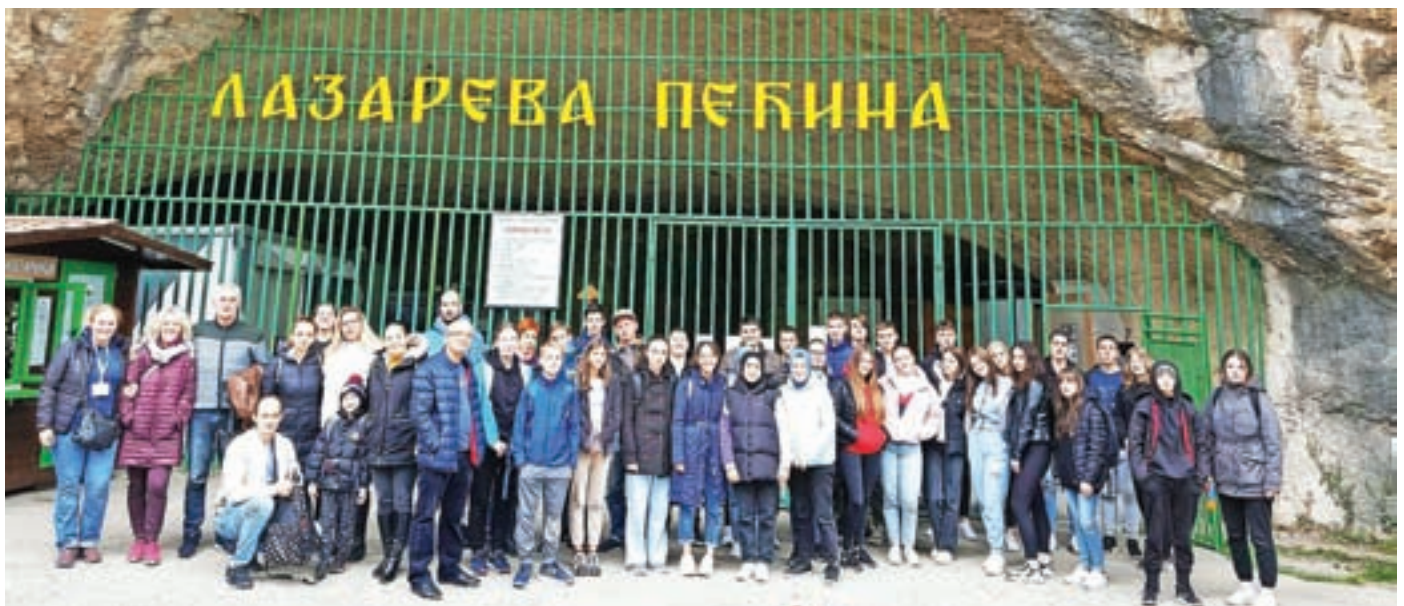
Bor je že vse od konca druge svetovne vojne naprej pomembno rudarsko mesto.

Učenci so hitro opazili, da je okrog njih precejšnja revščina. Številne hiše so nedokončane, mnoge zgradbe propadajo, ker bodisi ni denarja za vzdrževanje bodisi so prazne, ker so se ljudje izselili. Na ulicah vidiš berače, po cestah se vozijo »prastari« avtomobili, vsepovsod se klattijo potepuški psi. Tudi srednja šola, ki je