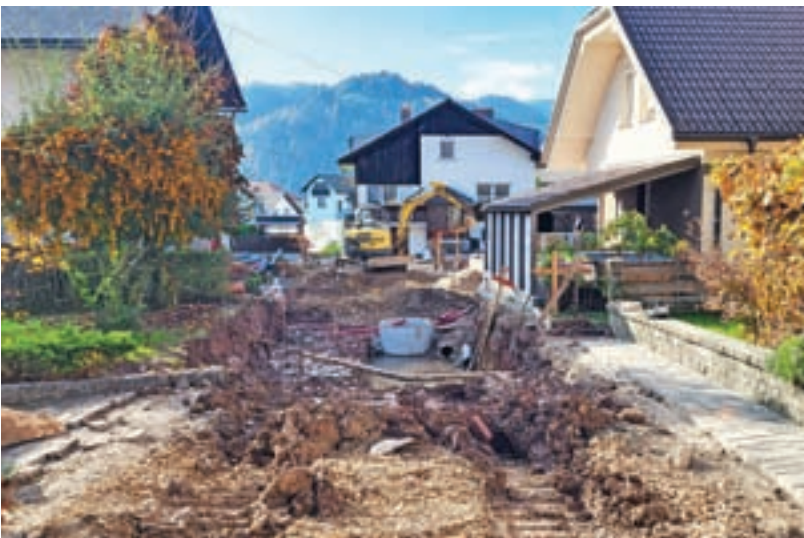
Pred kratkim se je začela obnova Ulice Maksima Sedeja.

Pomembna pridobitev je še 1,4 milijona evrov vredna nova cesta skozi industrijsko cono, ki jo bodo po pričakovanjih končali v enem mesecu. »Gre za novogradnjo v dolžini šeststo metrov – to je glavna prometnica, ki povezuje industrijsko cono od potoka Rakulščica do reke Račeve. Sočasno z novo cesto smo zgradili tudi novo vodovodno, kanalizacijsko, električno in telekomunikacijsko omrežje, obenem pa poskrbeli za prestavitev obstoječih komunalnih vodov, kar je bil precej zahteven podvig.« Za naložbo si obetajo tudi nepovratna evropska in državna sredstva, in sicer naj bi jim povrnili približno 70 odstotkov upravičenih stroškov.