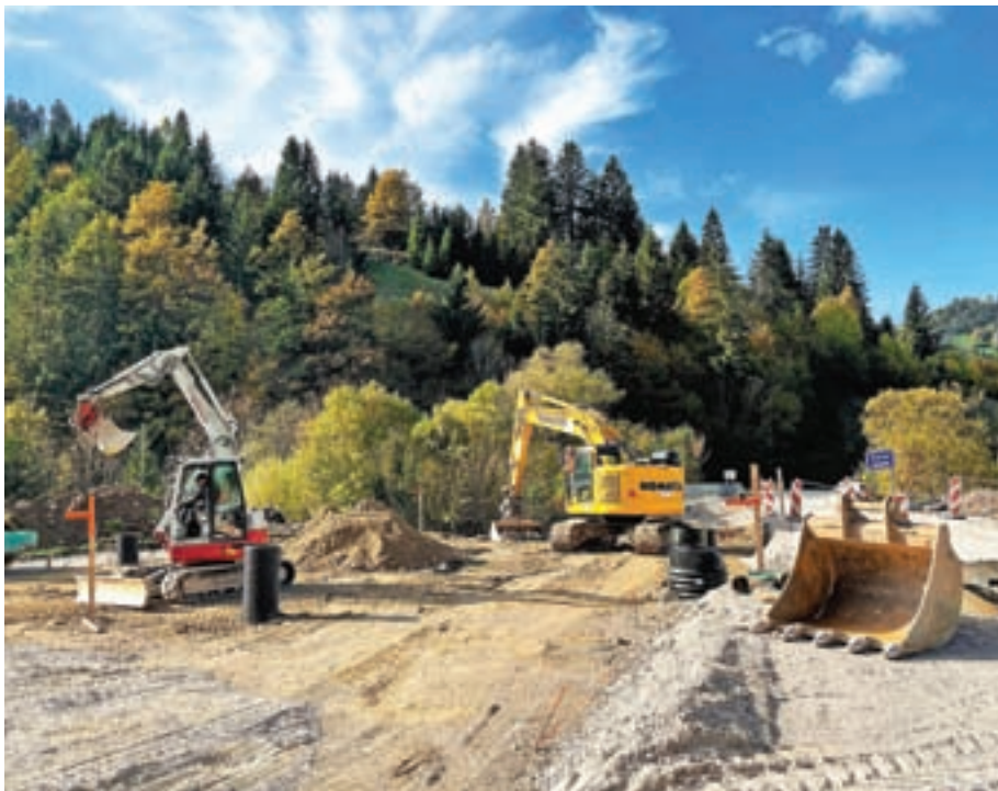
Ob ugodnih vremenskih razmerah bodo v kratkem končali prvo fazo gradnje obvoznice od cerkve do logaškega mostu.

Prvo fazo gradnje obvoznice od cerkve do logaškega mostu bodo v kratkem končali, če bodo vremenske razmere to dopuščale.