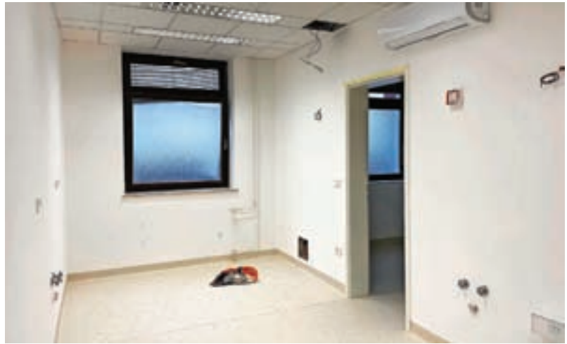
V zdravstvenem domu urejajo novo zobozdravstveno ambulanto.

»Pripravljanje projekta smo začeli spomladi, gradbena in obrtniška dela so se začela avgusta, v najboljšem primeru bo ordinacija nared v drugi polovici novembra,« so razložili v ZD Škofja Loka. V preteklem tednu so tako zaključili mizarska dela, v tem tednu pa sledi še dobava in montaža zobozdravniškega stola. Celotna naložba bo vredna 71 tisoč evrov.