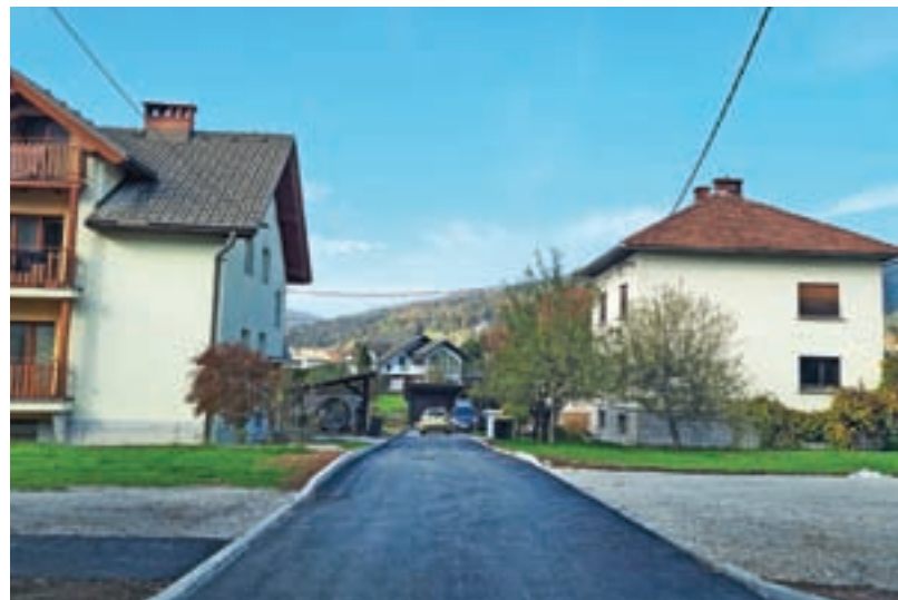
Obnova Dražgoške ulice je zaključena.

količino padavin na srečo ni bilo veliko škode na javni infrastrukturi,« je zadovoljen Kranjc.