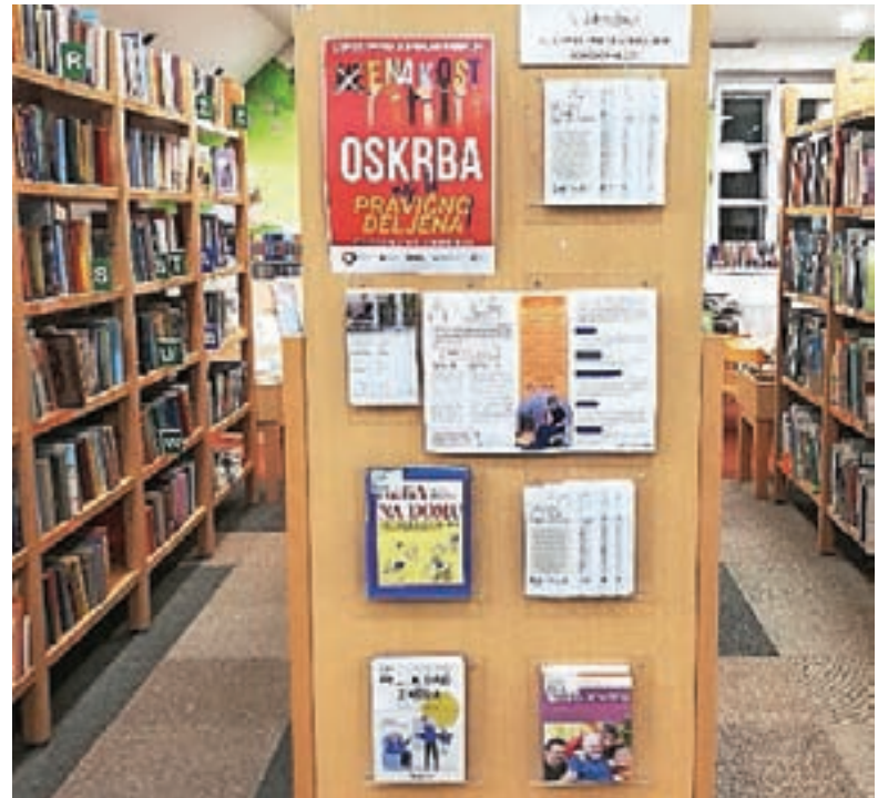
Stojnica v Krajevni knjižnici Žiri

Inštitut Antona Trstenjaka, Starosti prijazne občine in Slovensko združenje neformalnih oskrbovalcev so ob dnevu neformalnih oskrbovalcev organizirali številne akcije po vsej Sloveniji. Poseben poudarek je bil na širjenju glasu o Združenju nefor-