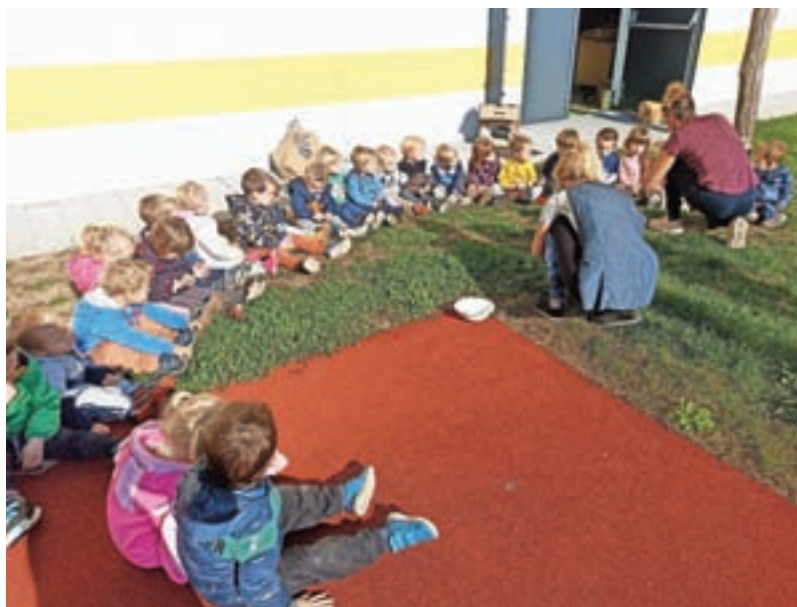
S kostanjem so se na pikniku sladkali tudi najmlajši.

Tudi nekaj kulture so si septembra in oktobra privoščili v vrtcu, saj se je s predstavo Juha, ki iz buč se skuha začel letošnji gledališki abonma za najmlajše, starejše skupine pa so si v Ljubljani ogledale operno predstavo Picko in Packo, v Galeriji žirovskega Muzeja pa razstavo žirovskih razglednic Simona Šubica. Okušali so tudi jesenske dobrote. Starejši otroci so na kmetiji Lojz spoznavali zelje in zeljarstvo, 21. oktobra, ob dnevu jabolok, so obiskali sadovnjak, za zaključek jeseni pa so si privoščili še sladko in veselo druženje na Kostanjčkovem pikniku.