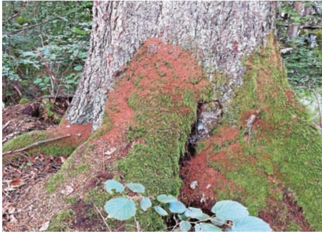
Lubadarke prepoznamo po rjavi črvini okoli koreničnika in za luskami skorje.

V drugi polovici julija se je začelo močno povečevati število s podlubniki napadenih dreves, zlasti smrek. Glavni vzrok za povečanje poškodb je letošnje izredno sušno in vroče poletje. Smreke so oslabele in postale manj odporne proti napadu podlubnikov, hkrati pa se je zaradi visokih temperatur razvoj podlubnikov pospešil. Vsa napadena drevesa še niso odkrita in popisana, obseg škode bo znan ob koncu zime. Povečan obseg poškodb zaradi podlub-