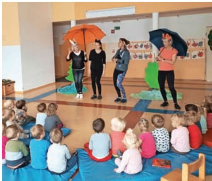
Vzgojiteljice so ob Tednu otroka navdušile v predstavi Pod medvedovim dežnikom.

Oktober so začeli s Tednom otroka. Najmlajši jaslični otroci so skupaj z vzgojiteljicami naredili plakat, otroci drugega jasličnega obdobja pa so ta teden uživali na plesni delavni-