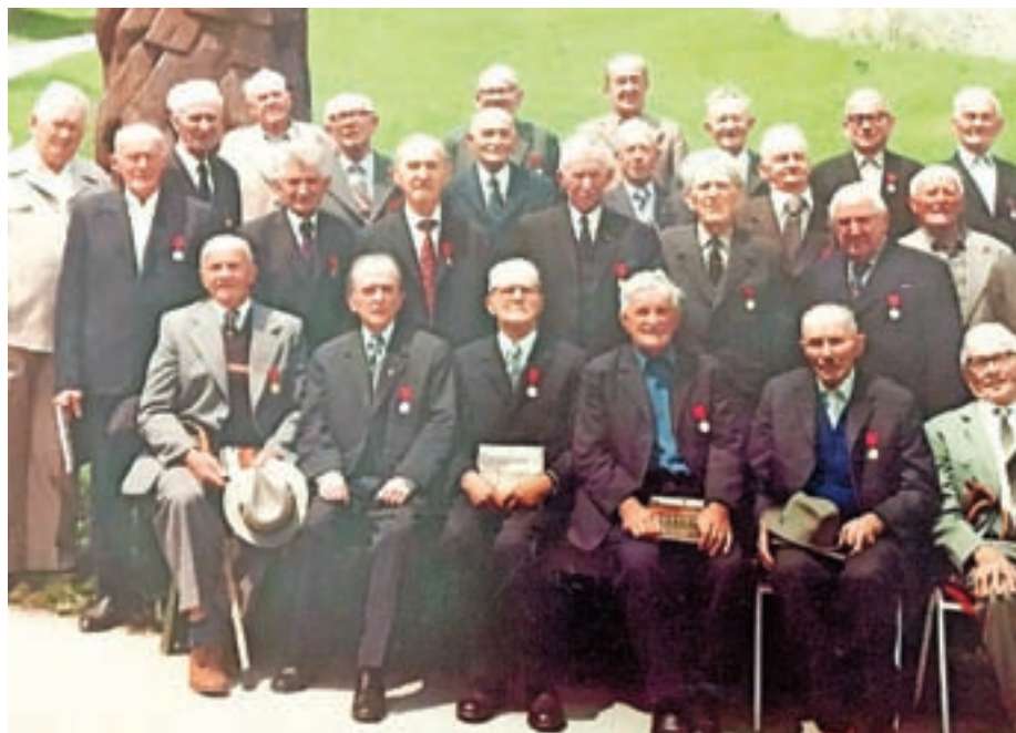
Fotografija 26 leta 1980 še živečih Maistrovih borcev iz takratne občine Škofja Loka (sedanja upravna enota).

O generalu Maistru in njegovih borcih se že pred drugo vojno ni kaj dosti govorilo, krvava morija druge svetovne vojne pa jih je potisnila še globlje v pozabo. Šele leta 1968 so preživeli Maistrovi borci dosegli, da je bil na ravni Republike Slovenije sprejet zakon o borcih za slovensko severno mejo. Po tem zakonu pa so status prostovoljca borca za slovensko severno mejo pridobili le tisti, ki so se v enote takratne slovenske vojske vključili do 31. januarja 1919. Vsi drugi so se šteli za mobilizirance in minimalnih bonitet niso bili deležni. V takratni občini Škofja Loka (sedanje območje upravne enote) je 64 oseb pridobilo status prostovoljca, v Žireh pa 16. Pridobiti tak status po petdesetih letih pa ni bilo enostavno. Vsak prosilec je